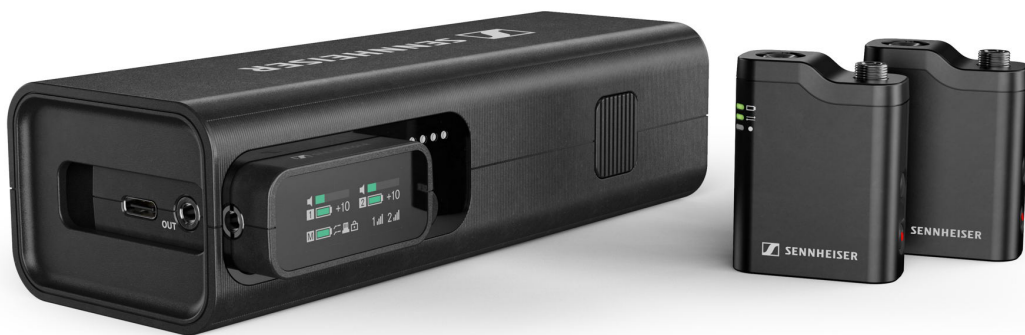
Profile Wireless is een tweekanaals alles-in-één clip-on en handheld microfoonstelsel

Ook de smalband digitale oplossingen van het bedrijf zullen te zien zijn, namelijk Digital 6000 en EW-DX met de nieuwe vierkanaals Dante-ontvanger, net als Sennheisers omroepmicrofoons, waaronder een gloednieuw topmodel dat onthuld zal worden op NAB . Voor contentcreators zal Sennheiser de Profile Wireless alles-in-één microfoonoplossing tonen.